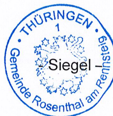
A. Neumüller Bürgermeister Gemeinde Rosenthal am Rennsteig